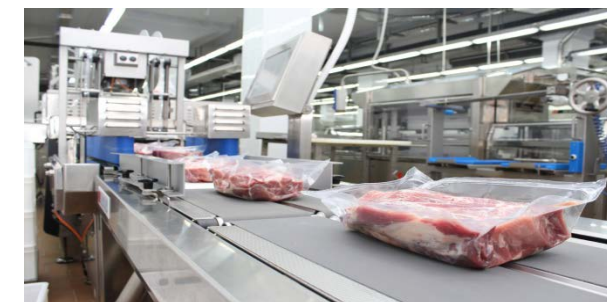
Сумма лизинга 42,5 млн. руб.