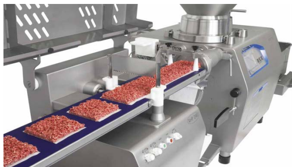
Стоимость оборудования 50 млн. руб.