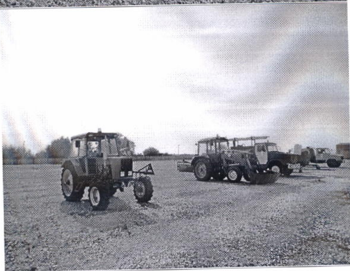
Фото сделаны фотоаппаратом Sony DSC-W350 инв.№5040355, 15.09.2015 года на территории земельного участка, расположенного по адресу: Московская область, Балашихинский район, д. Черное, владение 172 с кадастровым номером 50:15:0000000:131519, площадью 35141 кв.м., принадлежащий ООО "Сенатор", на праве собственности.

главный специалист отдела земельных отношений Управления имущественных отношений Администрации г.о. Балашиха