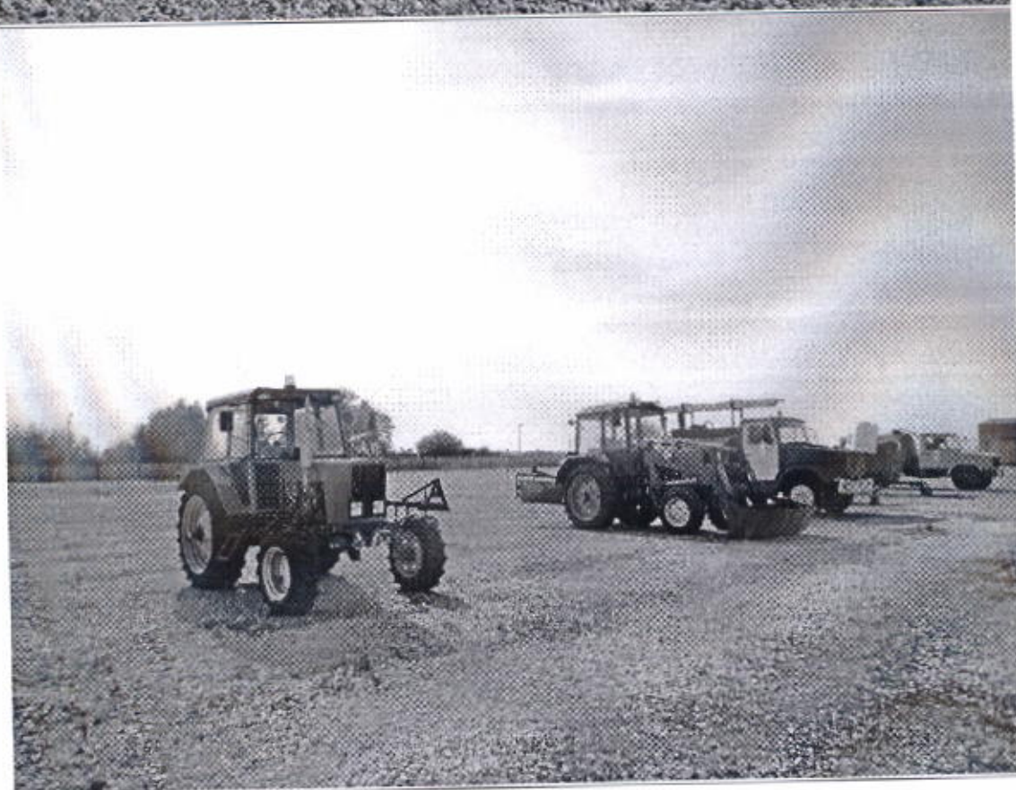
Фото сделаны фотоаппаратом Sony DSC-W350 инв.№5040355, 15.09.2015 года на территории земельного участка, расположенного по адресу: Московская область, Балашихинский район, д. Черное, владение 172 с кадастровым номером 50:15:0000000:131519, площадью 35141 кв.м., принадлежащий ООО "Сенатор", на праве собственности.

главный специалист отдела земельных отношений Управления имущественных отношений Администрации г.о. Балашиха