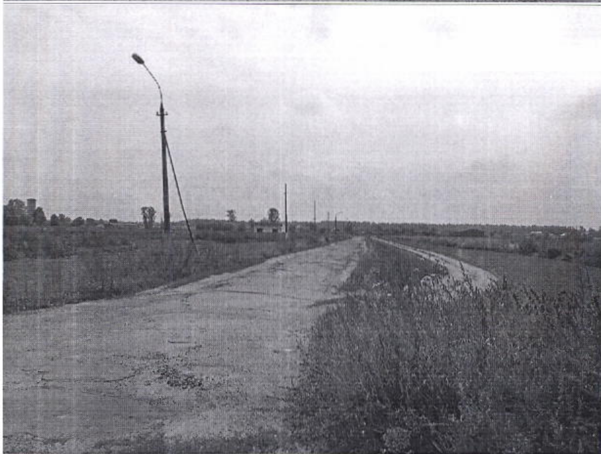
Фото сделаны 01.09.2015 года на территории земельного участка, расположенного по адресу: Московская область, Балашихинский район, с кадастровым номером 50:15:0050401:23, площадью 78700 кв.м., принадлежащий Государственному племенному птицеводу "Кучинский" на праве постоянного бессрочного пользования.

главный специалист отдела земельных отношений Управления имущественных отношений Администрации г.о. Балашиха